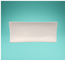
Miniplatte 14 x 6,6 x 2,3 cm