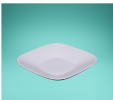
Schälchen Cumulus 12 x 12 cm

Die aufgeführten Fingerfoodschalen kann man sich unter folgendem Link anschauen