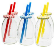
Flasche mit Drinkhalm-Deckel 250 ml

https://www.allesklar-verleih.com/miet-produkte/auf-dem-tisch/flying-buffet-fingerfood/