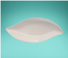
Wellenformschale 19 x 10 x 3,5 cm