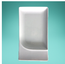
Fine Dining Platte rechteckig-Flach 20 x 11 cm